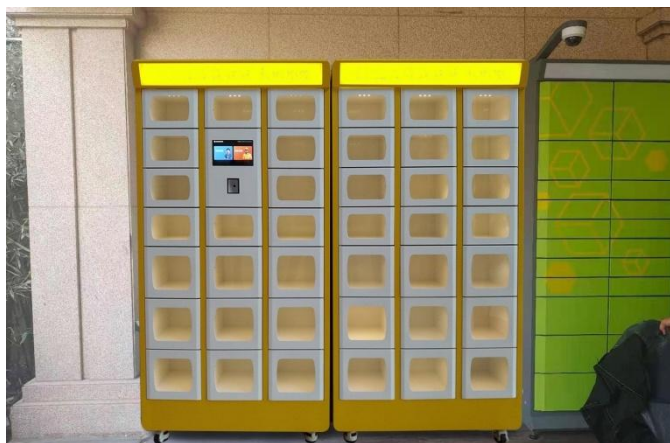
Slika 7: 40 boksova, površina 0.8m 2 , cijena cca 8.000,00KM