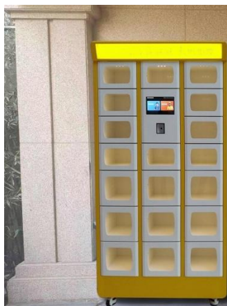
Slika 6: 19 boksova, površina 0.4m 2 , cijena cca 4.200,00KM